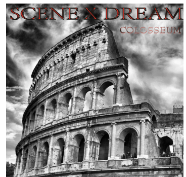
SCENE X DREAM Colosseum 1995 New Release 2014