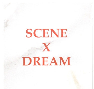
SCENE X DREAM Scene X Dream 1992 New Release 2014